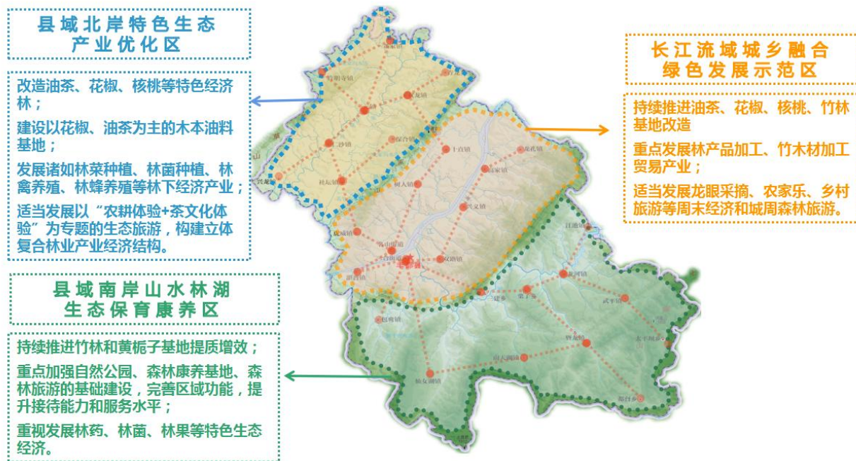
丰都县林业“十四五”发展规划产业分布图

立足丰都特色生态产业基础与优势，打造“特色经济林、竹产业、林下经济为基础，生态旅游及森林康养产业、林产品加工贸易产业为重点”的“3+2”林业生态产业体系。