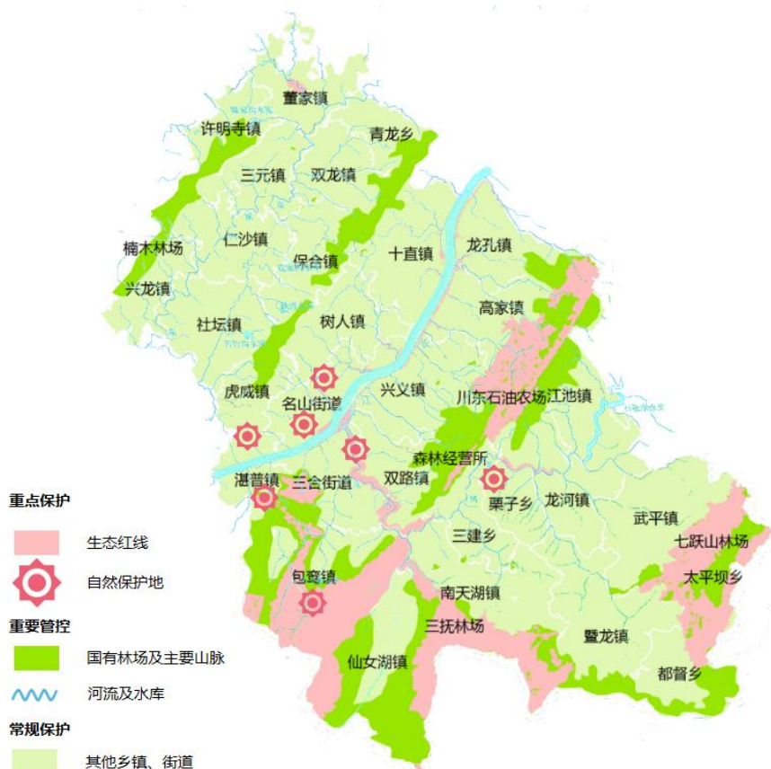
丰都县林业“十四五”发展规划生态保护布局图

生态保护以生态红线和自然保护地为重点保护区域，以除生态红线以外的国有林场、主要山体和河流为重要管控区域，以其他乡镇为常规保护区域，通过严格森林资源保护管理、全面加强物种多样性保护、完善自然保护地体系建设、积极开展湿地保护修复、森林防火能力建设、林业有害生物防治等方式加强生态保护。