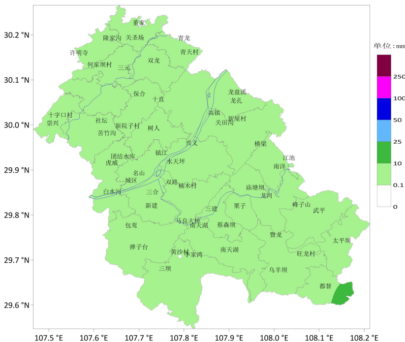
丰都县 2022 年 11 月 18 日 20 时—11 月 25 日 16 时降水分布图

本周（11 月 18 日到 25 日）我县天气阴雨相间，累计最大降水量为 12.5mm（都督沙坪村）。丰都国家基本站最高气温 21.7℃，最低气温 12.7℃，降雨量 0.7 毫米。